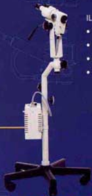
COLPOSCÓPIO CP-M2500 IDEAL PARA CONSULTÓRIOS

ESTATIVAS RESISTENTES E COM LONGA VIDA ÚTIL, ADEQUADAS PARA CLÍNICAS E AMBULATÓRIOS